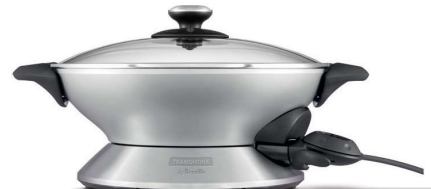
Wok Chef 69120/011 - 127V 69120/012 - 220V 41