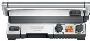
Smart Grill 69035/011 - 127V 69035/012 - 220V 31