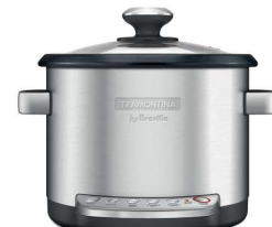
Multi Cook 69121/011 - 127V 69121/012 - 220V 42