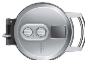
Pizza Express 69141/011 - 127V 69141/012 - 220V 37