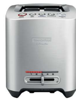
Torradeira Smart 69045/011 - 127V 69045/012 - 220V 28