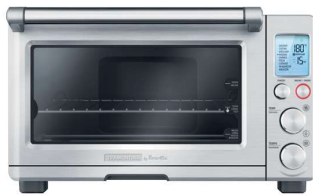
Forno Elétrico Smart 69140/011 - 127V 69140/012 - 220V 36