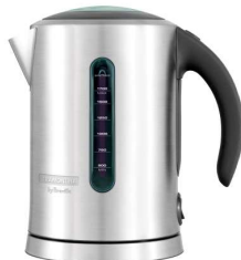
Chaleira Express 69091/011 - 127V 69091/012 - 220V 13