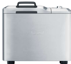
Pan Express 69030/011 - 127V 69030/012 - 220V 39