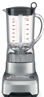
Liquidificador Smart Gourmet 69005/011 - 127V 69005/012 - 220V 15