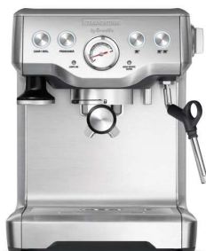
Cafeteira Express 69065/011 - 127V 69065/012 - 220V 08