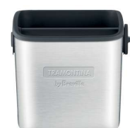
Coffee Box 69085/010 09