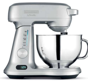
Batedeira Mix Pro 69015/011 - 127V 69015/012 - 220V 18