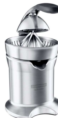
Espremedor Express 69000/011 - 127V 69000/012 - 220V 21