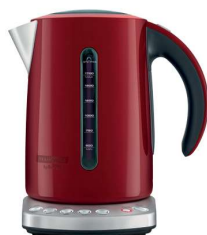
Chaleira Smart 69092/021 - 127V 69092/022 - 220V 12