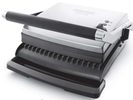
Adjusta Grill 69034/011 - 127V 69034/012 - 220V 30