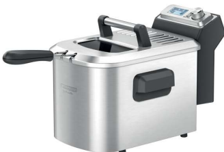
Fritadeira Smart 69160/011 - 127V 69160/012 - 220V 43