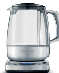
Gourmet Tea 69110/011 - 127V 69110/012 - 220V 11