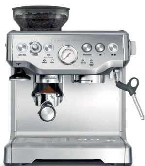
Cafeteira Express Pro 69066/011 - 127V 69066/012 - 220V 07