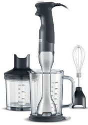
Soft Mixer 69025/011 - 127V 69025/012 - 220V 19