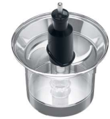
Minilâmina e Minitigela