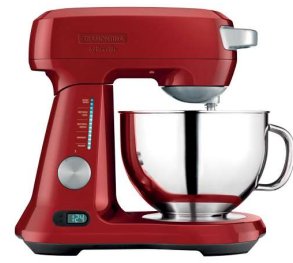
Batedeira Mix Pro 69015/021 - 127V 69015/022 - 220V 18