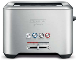
Torradeira Express 69044/011 - 127V 69044/012 - 220V 27