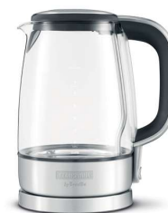
Transparenza 69090/011 - 127V 69090/012 - 220V 13