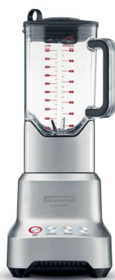
Liquidificador Gourmet Pro 69006/011 - 127V 69006/012 - 220V 16