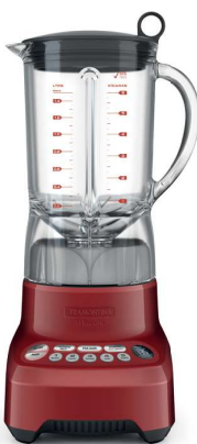
Liquidificador Smart Gourmet 69005/021 - 127V 69005/022 - 220V 15