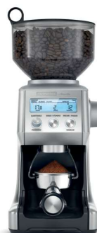
Moedor Express 69060/011 - 127V 69060/012 - 220V 09