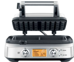
Smart Waffle 69058/011 - 127V 69058/012 - 220V 34