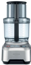
Multiprocessador Slice Pro 69020/011 - 127V 69020/012 - 220V 25