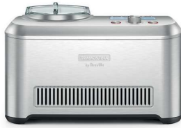
Gelato Express 69170/011 - 127V 69170/012 - 220V 23