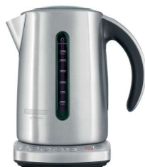
Chaleira Smart 69092/011 - 127V 69092/012 - 220V 12