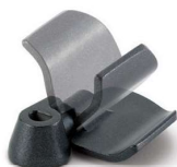
Lâmina Dobrável Exclusiva para Sovar