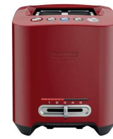
Torradeira Smart 69045/021 - 127V 69045/022 - 220V 28