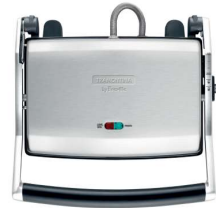
Sanduicheira Express 69054/011 - 127V 69054/012 - 220V 32